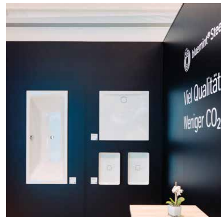
Die Produkte der Kaldewei Limited Edition nature protect wurden auf der Blechexpo erstmals einem Publikum präsentiert.

Nachhaltigkeit auch in Zukunft weiter vorantreiben und mit nature protect gibt es bereits heute eine klimafreundliche Lösung auf dem Weg zur Emissionsfreiheit. Dies ist auch als ein unternehmerischer Beitrag zur Erreichung des 1,5 Grad Zieles zu sehen, welches in Paris im Rahmen der UN-Klimakonferenz seinen Ursprung hat und von 195 Staaten unterzeichnet seit 2019 in Kraft ist.