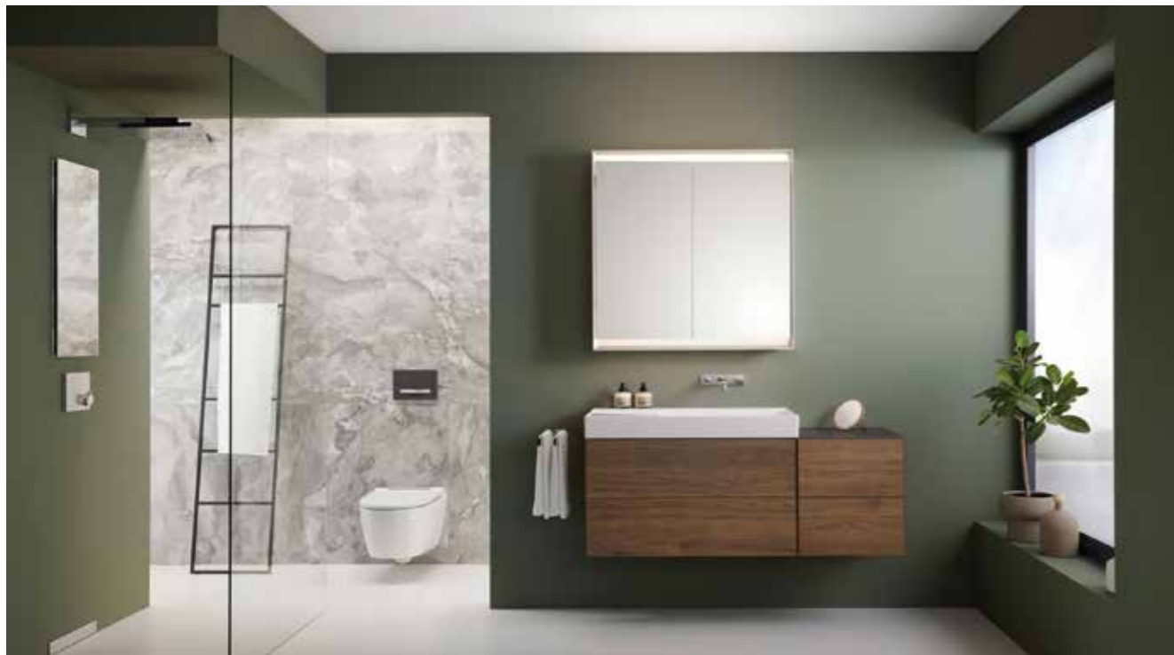
Die Geberit ONE Neuheiten mit modernen Waschtisch-Designs, modularem Möbelkonzept und Spiegelschränken bringen viele individuelle Gestaltungsmöglichkeiten ins Badezimmer.