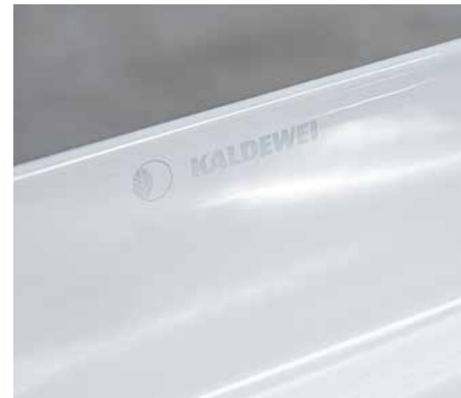
Alle Produkte der Kaldewei Limited Edition nature protect sind per Laser-Logo gekennzeichnet.

Mit diesem neuen CO 2 -reduziertem Stahl eröffnet Kaldewei seinen Kunden die Möglichkeit, nachhaltig geplante Bauprojekte mit klimafreundlichen Badlösungen aus edler Stahl-Emaille auszustatten, die sich durch Ihre lange Produktlebensdauer sowie eine besonders gute CO 2 -Bilanz auszeichnen. Darüber hinaus sind sie zu 100 Prozent kreislauffähig. „Mit der Kaldewei Limited Edition nature protect dürfen wir unseren Kunden Badezimmerobjekte mit herausragend niedrigem CO 2 Fussabdruck anbieten. Premiumprodukte, die modernen Luxus in Form von edler Materialität und sinnlichem Design mit nachhaltigem Denken und Handeln verbinden. Wir nennen das „Luxsustainability“, erklärt CEO Franz Kaldewei. Luxsustainability bedeutet nicht weniger