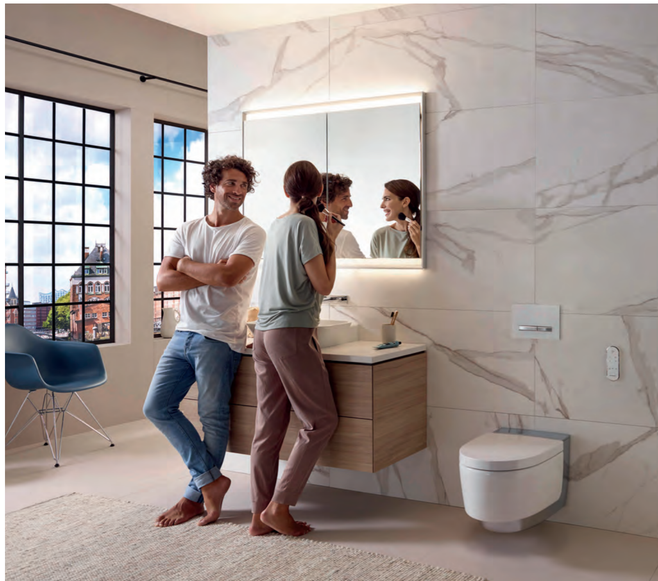
Das Badezimmer ist ein wichtiger Ort für die persönliche Hygiene.

HYGIENE UND EIN SAUBERES GEFÜHL IM INTIMBEREICH HABEN EINEN HOHEN STELLENWERT IN DEUTSCHLAND. WIE VIEL ZEIT DIE DEUTSCHEN TATSÄCHLICH FÜR IHRE KÖRPERHYGIENE AUFWENDEN HAT SANITÄRSPEZIALIST UND BADAUSSTATTER GEBERIT IN EINER ENDVERBRAUCHER-UMFRAGE* ERMITTELT.