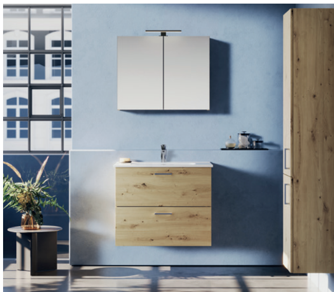
FORMAT Basic Badmöbel