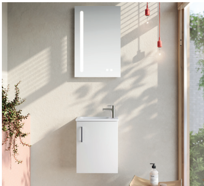
FORMAT Basic Gäste-WC Set

Gestalten Sie gemeinsam mit Ihrem FORMAT Fachhändler Ihr neues Badezimmer. Unter www.format.eu finden Sie Ihren Badprofi in der Nähe.