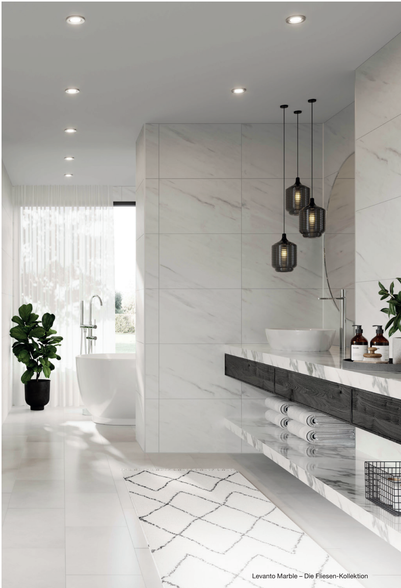
Levanto Marble – Die Fliesen-Kollektion