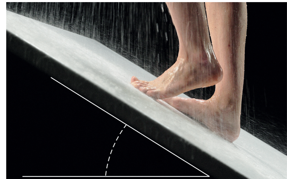
Geprüfte Standfestigkeit: Die LGA Bautechnik bestätigt Invisible Grip eine Rutschhemmung gemäß Bewertungsklasse C für nassbelastete Barfußbereiche nach DIN EN 16165.

Invisible Grip steht wie jedes Produkt der Luxsustainability®-Welt von Kaldewei für kompromisslose Sicherheit und Vertrauen verbunden mit einer hochästhetischen Oberflächenbeschaffenheit. Oder anders gesagt: In Glamour We Trust. Invisible Grip zeigt einmal mehr die besondere Innovationskompetenz von Kaldewei, für die der Premiumhersteller mit dem Siegel der Bescheinigungsstelle Forschungszulage (BSFZ) ausgezeichnet worden ist.