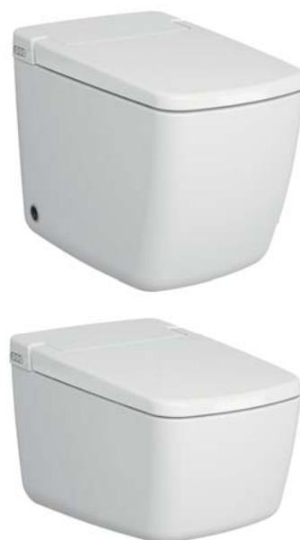
V-Care Prime ist in 2 Versionen erhältlich: bodenstehend und wandhängend.